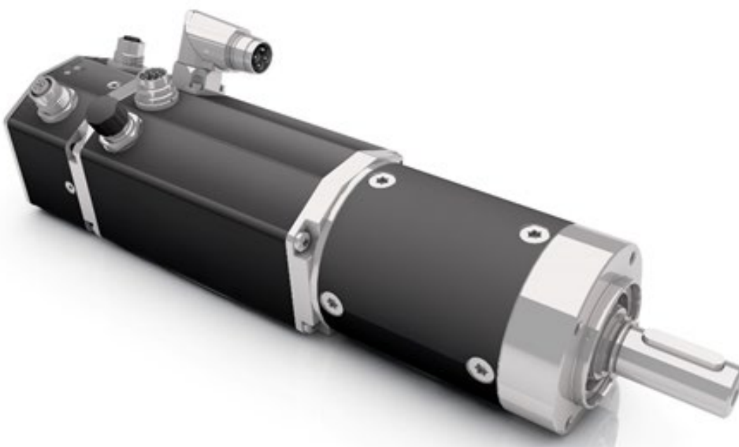
Abbildung 1: BLDC-Motor BG 75 EC mit PLG 75

BLDC (Brushless Direct Current) und EC (Electrically Commutated) Servomotoren sind technisch gesehen permanenterregte Synchronmotoren. Oft werden diese Begriffe noch mit eher kleinen, blockkommutierten Motoren, die im Kleinspannungsbereich betrieben werden, verbunden. Mittlerweile werden die als BLDC und EC bezeichneten Motoren häufig feldorientiert angesteuert, wodurch sie in Sachen Dynamik, Geräuschverhalten und Energieeffizienz den als „AC Servo“ bezeichneten Motoren in nichts nachstehen.